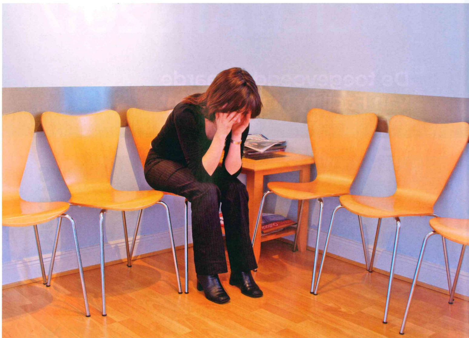
Nabestaanden hebben straks onder voorwaarden recht op inzage dossier na overlijden dierbare.

Op dit moment is er geen wettelijke regeling die bepaalt wanneer inzage in het medisch dossier verleend zou moeten worden aan nabestaanden van een overleden patiënt. Een voorgestelde wijziging van de Wet op de geneeskundige behandelingsovereenkomst (WGBO) brengt hierin verandering. Zorginstellingen kunnen dan vaker te maken krijgen met een te honoreren verzoek van nabestaanden om inzage.